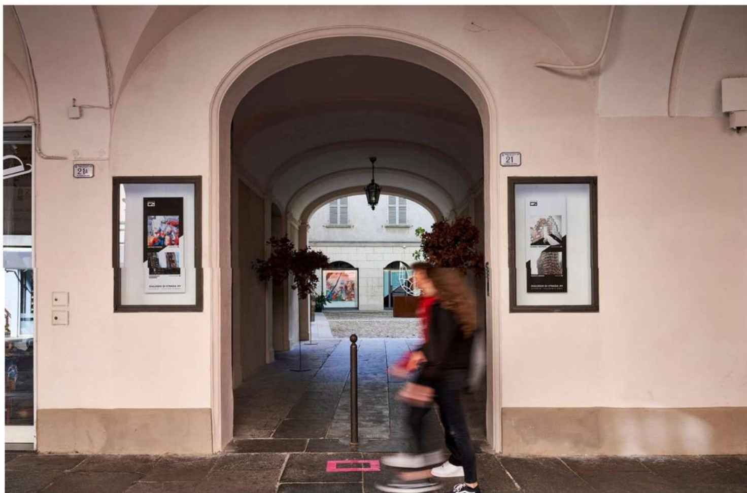
Un'immagine dello spazio C21 di Reggio Emilia