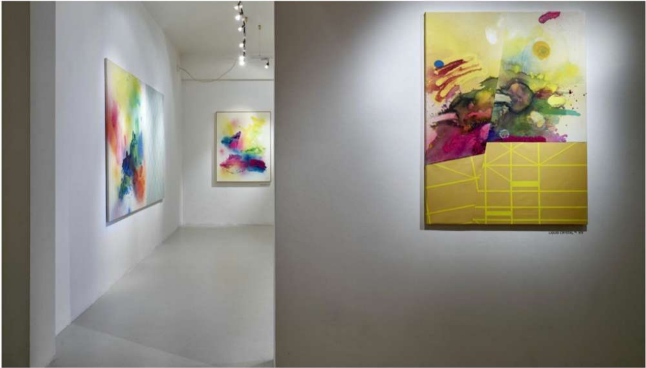
Moses & Taps, "Liquid Crystal", installation view at Spazio C21 – Palazzo Brami, Reggio Emilia

Nella misura in cui le persone si relazionano con gli interventi con cui entrano in contatto.