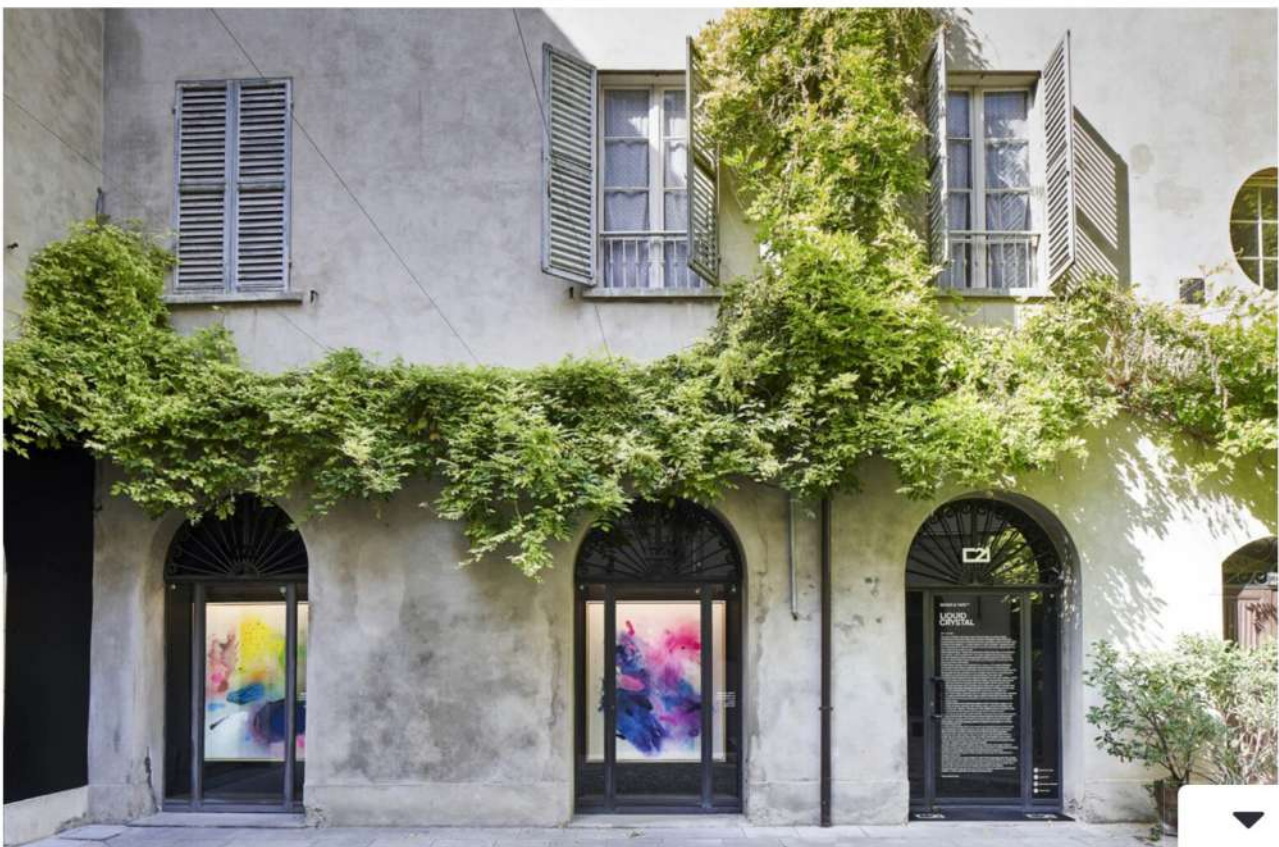
Moses & Taps, "Liquid Crystal", installation view at Spazio C21 – Palazzo Brami, Reggio Emilia

Moses & Taps è un collettivo di artisti tedeschi che dal 1994 dissemina interventi pubblici in giro per il mondo. Stazioni ferroviarie e spazi cittadini rappresentano l'ambiente ideale, i centri magnetici da cui s'irradia ogni azione: sui treni, scritte, segni e spruzzi diffondono codici che viaggiando raggiungono posti e luoghi imprevisi. Essenziali protagonisti della Street Art, sono riusciti nel tentativo di vaporizzare il writing in macchie colorate dando forma a quello che chiamano il "Corporate Identity": è il colore, anziché le tag, a definire la riconoscibilità. Tutto confluisce nella mostra di Reggio Emilia, dove la ricerca personale presenta nuovi elementi in differenti rapporti tra forma e colore, tra gli splash esuberanti e i pattern regolari. Ne parliamo in questa intervista.