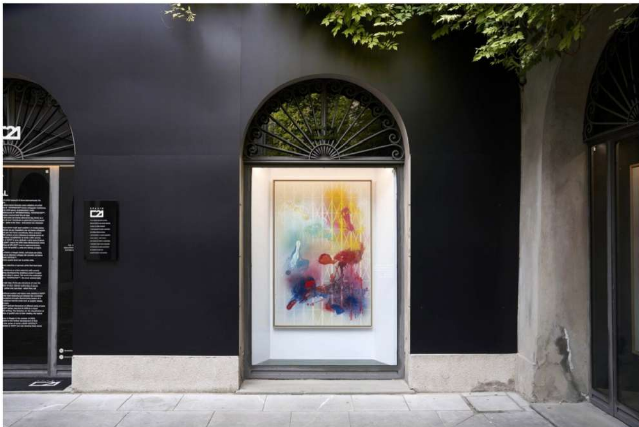
Moses & Taps, "Liquid Crystal", installation view at Spazio C21 – Palazzo Brami, Reggio Emilia

Moses & Taps: Alcuni lavori per la mostra sono stati preparati nei nostri studi ad Amburgo. Ma la nostra pittura nasce dai graffiti ed è quindi caratterizzata dalla spontaneità e dalla specificità del luogo. Per l'essenza di un dipinto l'ambiente in cui viene realizzato è immensamente importante. È molto differente lavorare all'aperto sotto il sole splendente, oppure sotto un cielo azzurro o in studio. L'uno o l'altro non rende l'immagine migliore, ma le conferisce un carattere diverso.