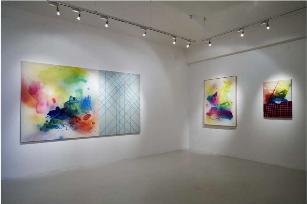
Moses & Taps, "Liquid Crystal", installation view at Spazio C21 – Palazzo Brami, Reggio Emilia

Cosa rimane del tutto, una volta fatte saltare le lettere, eliminate le scritte, fatta vacillare l'idea stessa di rappresentazione?