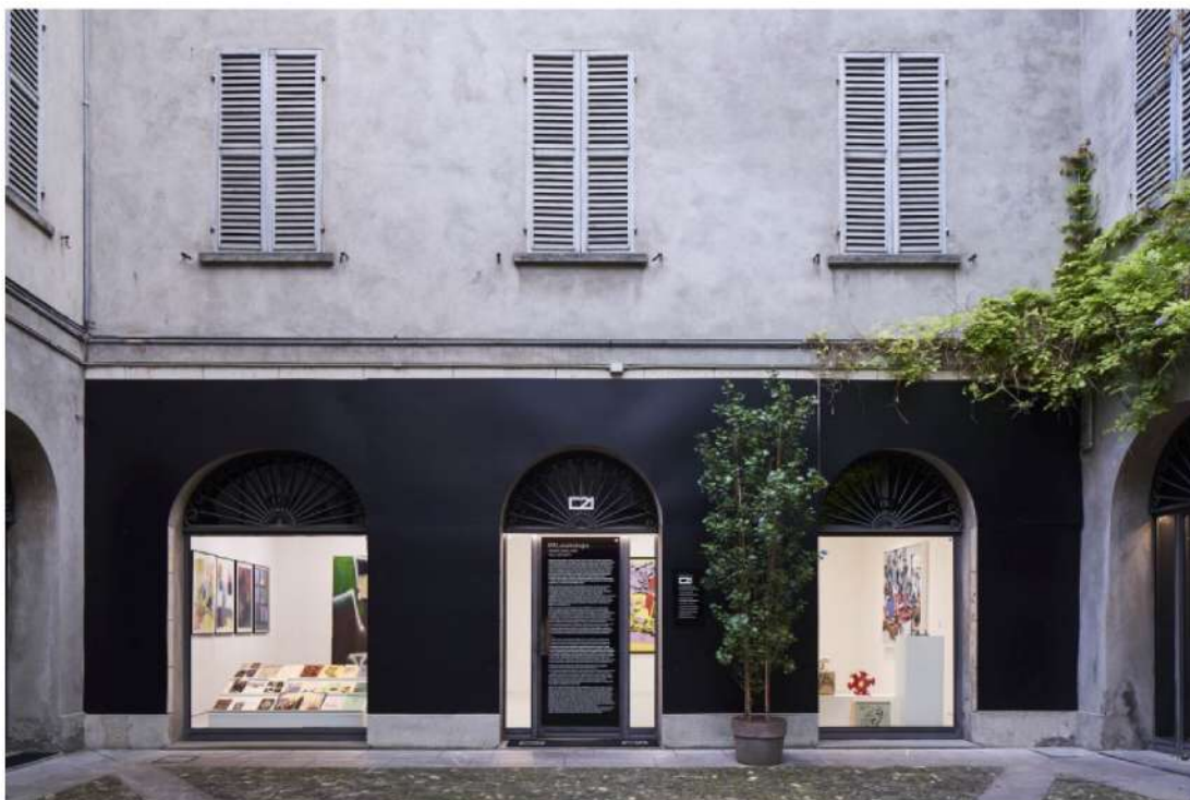
PALeontologia, ph Fabrizio Cicconi

Centro pulsante a Reggio Emilia per l'esplorazione del movimento dei graffiti e dell'arte urbana, sia nella sua forma più cruda che nelle sue espressioni in galleria, SPAZIOC21 presenta, fino al 14 settembre 2024, PALeontologia , mostra che riunisce le opere di Horfee, Saeio e Conie . Negli spazi di Palazzo Brami, un'immersione profonda nella produzione "di studio" di tre membri dei PAL, l'acronimo che sta per Peace and Love, la crew di writers che ha fatto storia nella scena parigina degli ultimi 20 anni.