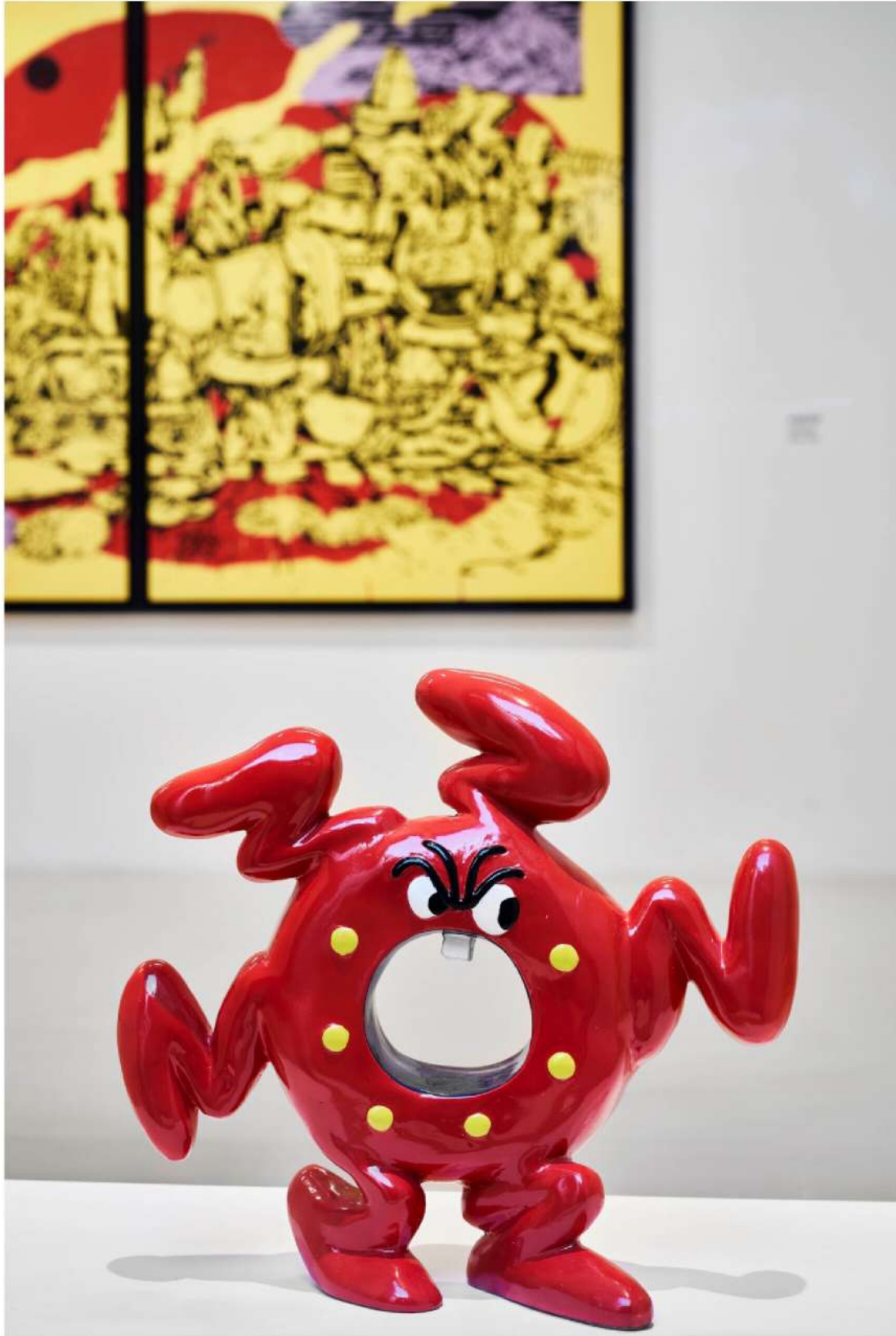
PA Leontologia

Come tributo affettuoso e vibrante al talento dei tre artisti, in esposizione opere pittoriche inedite, sculture, scatti catturati dall'obiettivo del fotografo ufficiale della crew, senza dimenticare le pubblicazioni d'epoca che ne documentano l'esplosiva creatività. I fondatori di SPAZIOC21, infatti, hanno una passione sfrenata per la carta stampata, che li ha spinti a costruire non solo un archivio vastissimo di materiali effimeri ma anche una biblioteca che è un vero tesoro per chi vuole studiare le diverse espressioni artistiche nate per strada.