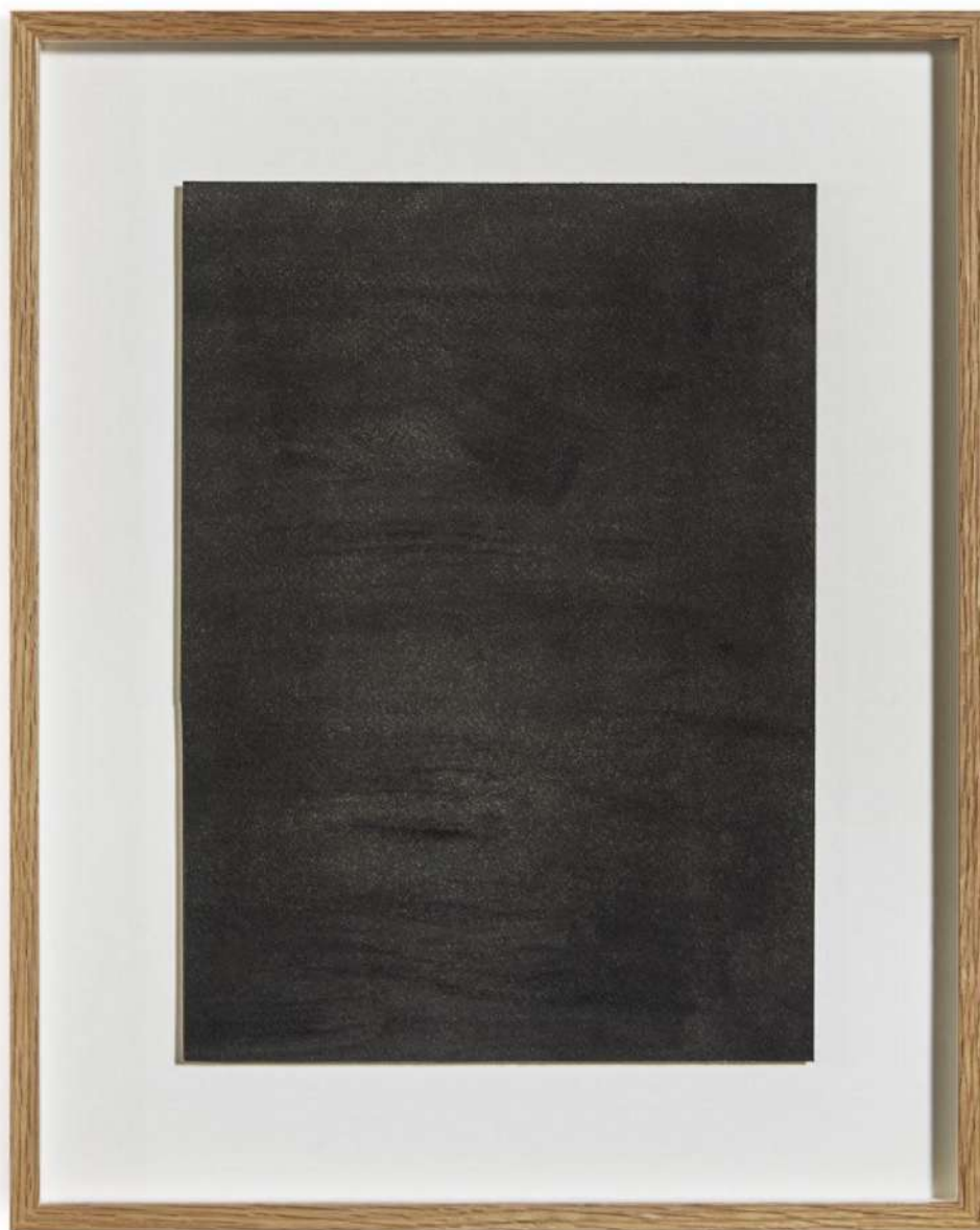
Escif, Polución 2023 Pollution ink on canvas Framed 41 x 33 cm ( Un 29 x 21 cm )