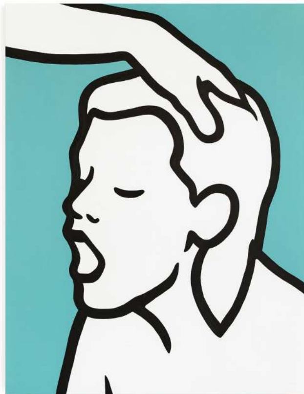
MP5, IMG_3519.png , 2024 Acrylic on canvas 130 x 100 cm

Il percorso di Mp5 attraversa arte pubblica, scenografia, illustrazione e installazioni. Ha collaborato con il mondo della moda – celebre il suo contributo alla campagna Chime for Change di Gucci – e con il teatro e l'editoria, lavorando con personaggi come Michela Murgia e Chiara Tagliaferri . Il suo libro monografico Corpus (Rizzoli Lizard, 2023) raccoglie anni di produzione e riflessione artistica.