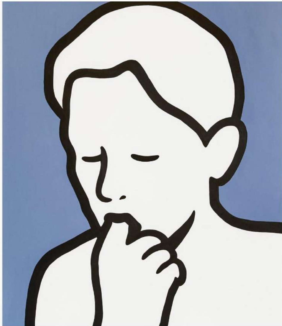
MP5, IMG_2223.png 2021 Acrylic on canvas 130 x 100 cm

Iconici, militanti, immediati ma anche sofisticati, sono i linguaggi visivi di Escif ed Mp5 , diversi come espressione ma affini nella profondità di una ricerca che interroga il presente per affrontarne le tensioni, le pulsioni, le suggestioni. A metterli in dialogo sono la galleria SPAZIOC21 e il progetto do ut do, in occasione della 48ma edizione di Arte Fiera , a Bologna, dal 7 al 9 febbraio 2025, all'interno della sezione Percorso , dedicata quest'anno al tema della comunità.