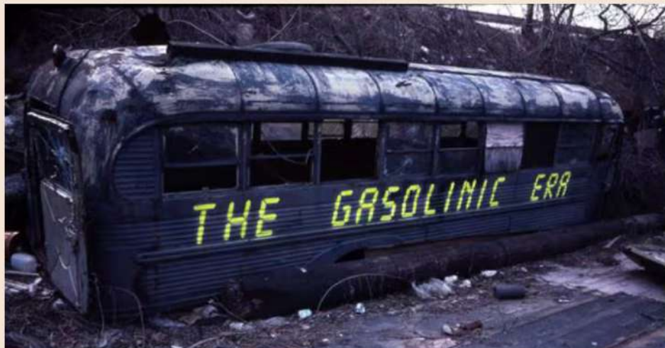
▲ The Gasolin Era, Queens, NY, USA, 1983

La panoramica selezionata di sessant'anni di pratica artistica presente in mostra rivela le motivazioni e l'energia che hanno alimentato la scena artistica urbana di New York fino agli anni '90, un contesto che ha contemporaneamente visto emergere la pratica dei graffiti, l'hip hop e la video arte underground oggi considerati mainstream, ma all'epoca ancora soltanto un grido ribelle nel mezzo del degrado.