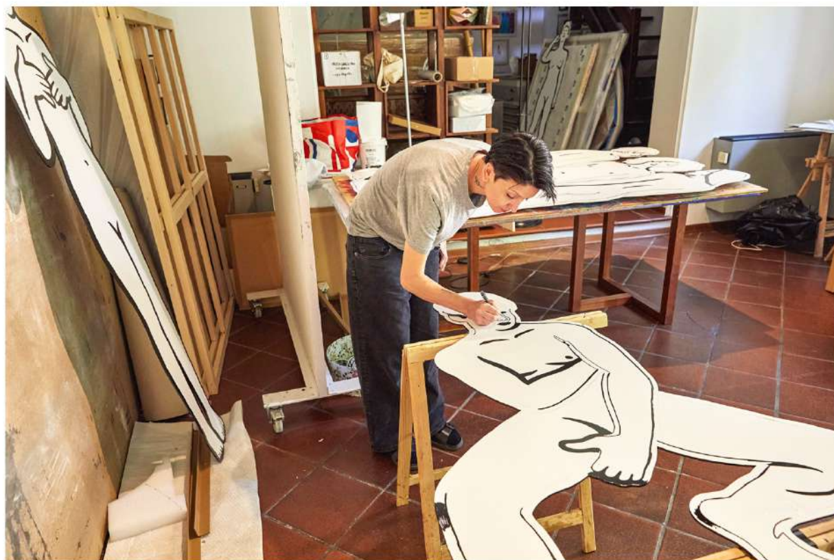
MP5, C21, Ph. Alessandro Bonori, 2025

Sulla facciata di Palazzo Brami, figure sospese in una dimensione di prossimità e reciprocità accoglieranno i visitatori, immerse in un giardino pensile immaginario. «Il progetto evoca l'esperienza intima di luoghi di attraversamento e di intensa prossimità e invita il pubblico in una dimensione di condivisione, al tempo stesso visiva e sensuale», scrive la curatrice Beatrice Leanza nel testo critico Progetti Umani . «Un habitat vivente in cui l'identità coincide con l'agire collettivo, dove siamo chiamati a riflettere proprio su quelle condizioni che permettono alle comunità di plasmare e coltivare un senso di spazio e di appartenenza».