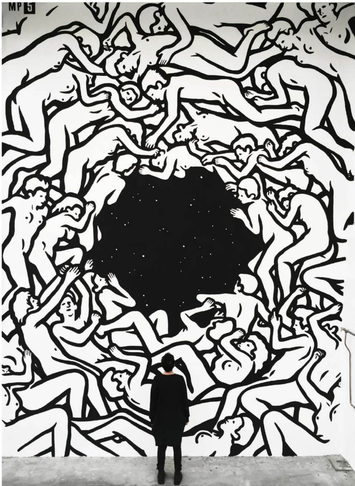
ONE, Modena 2018, Courtesy of MP5

Sulla facciata di Palazzo Brami, figure sospese in una dimensione di prossimità e reciprocità accoglieranno i visitatori, immerse in un giardino pensile immaginario. «Il progetto evoca l'esperienza intima di luoghi di attraversamento e di intensa prossimità e invita il pubblico in una dimensione di condivisione, al tempo stesso visiva e sensuale», scrive la curatrice Beatrice Leanza nel testo critico Progetti Umani . «Un habitat vivente in cui l'identità coincide con l'agire collettivo, dove siamo chiamati a riflettere proprio su quelle condizioni che permettono alle comunità di plasmare e coltivare un senso di spazio e di appartenenza».