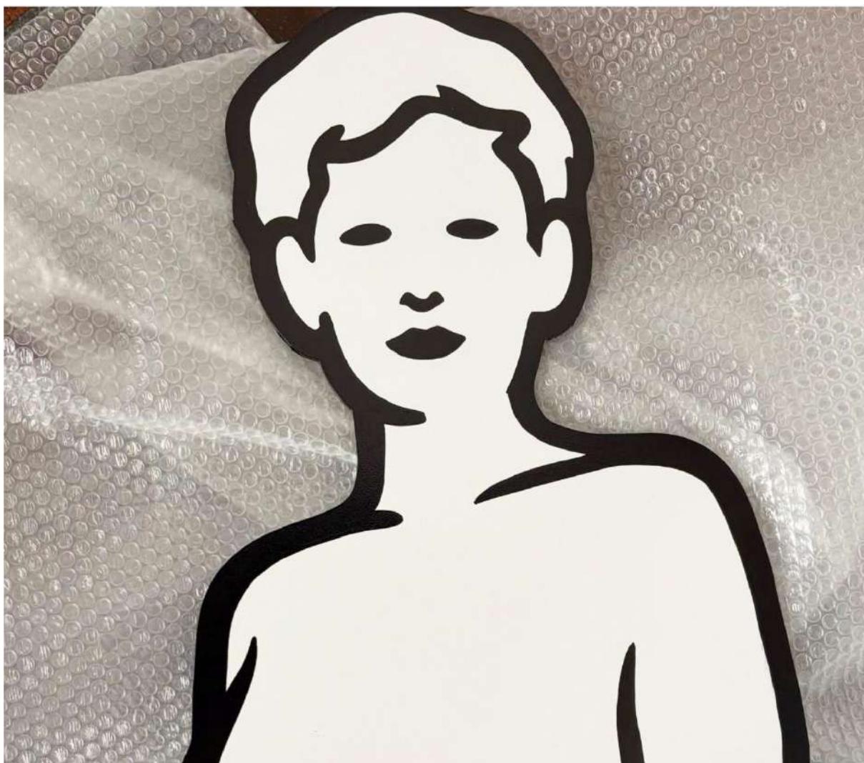
MP5, C21, iris, tecnica mista su alluminio _ 198x49 cm, 2025

Dodici sculture e un'installazione site specific trasformeranno Palazzo Brami di Reggio Emilia in un paradiso collettivo: il nuovo progetto di MP5 per SpazioC21