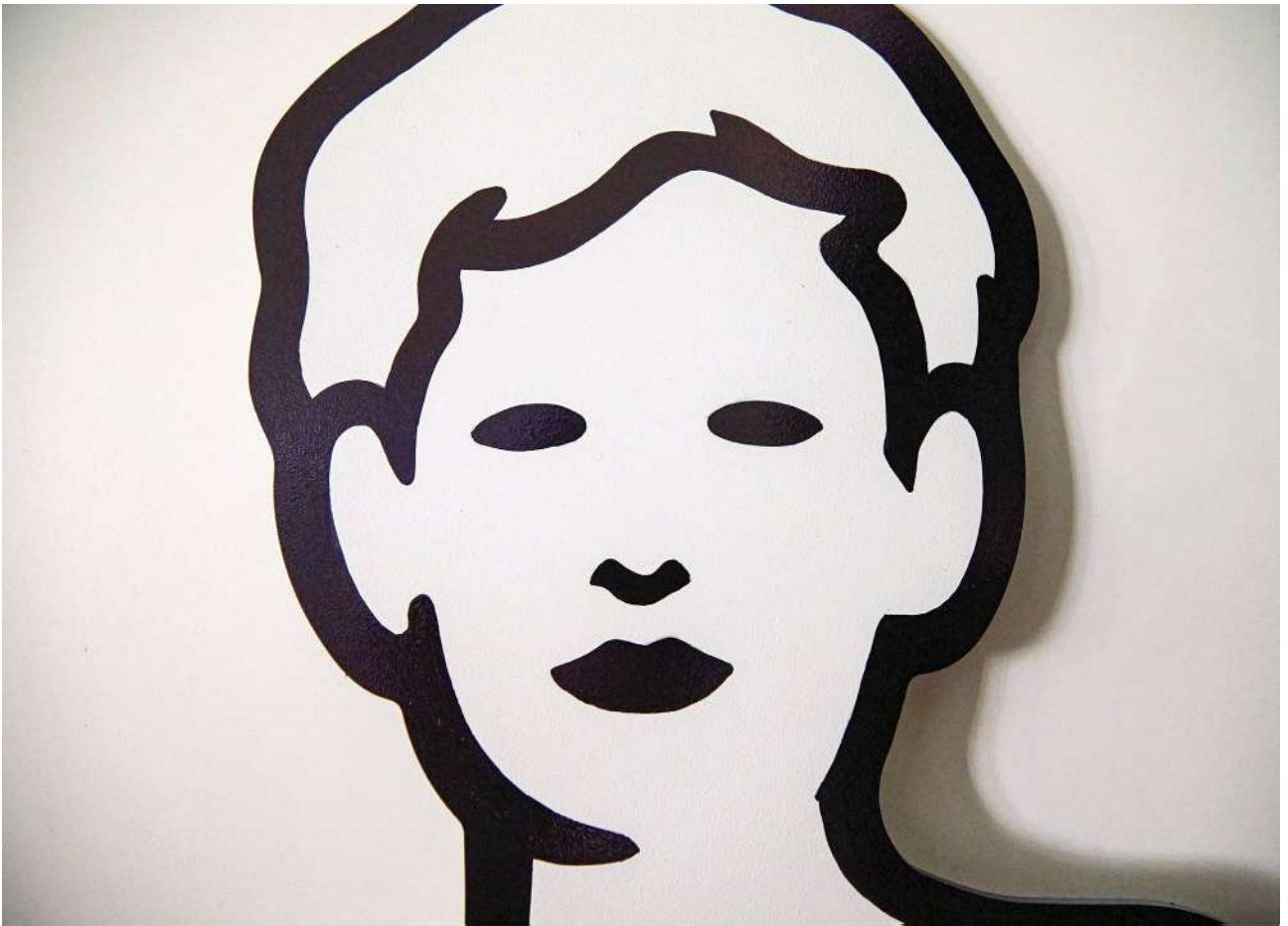
MP5 – SpazioC21. Titolo opera: Iris, tecnica mista su alluminio, 198×49 cm. 2025.