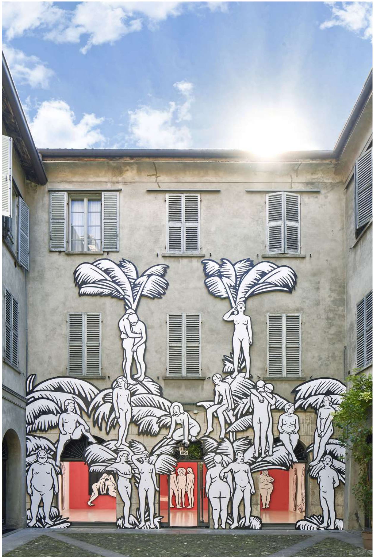
MP5 - "paradiso", allestimento, SPAZIOC21.