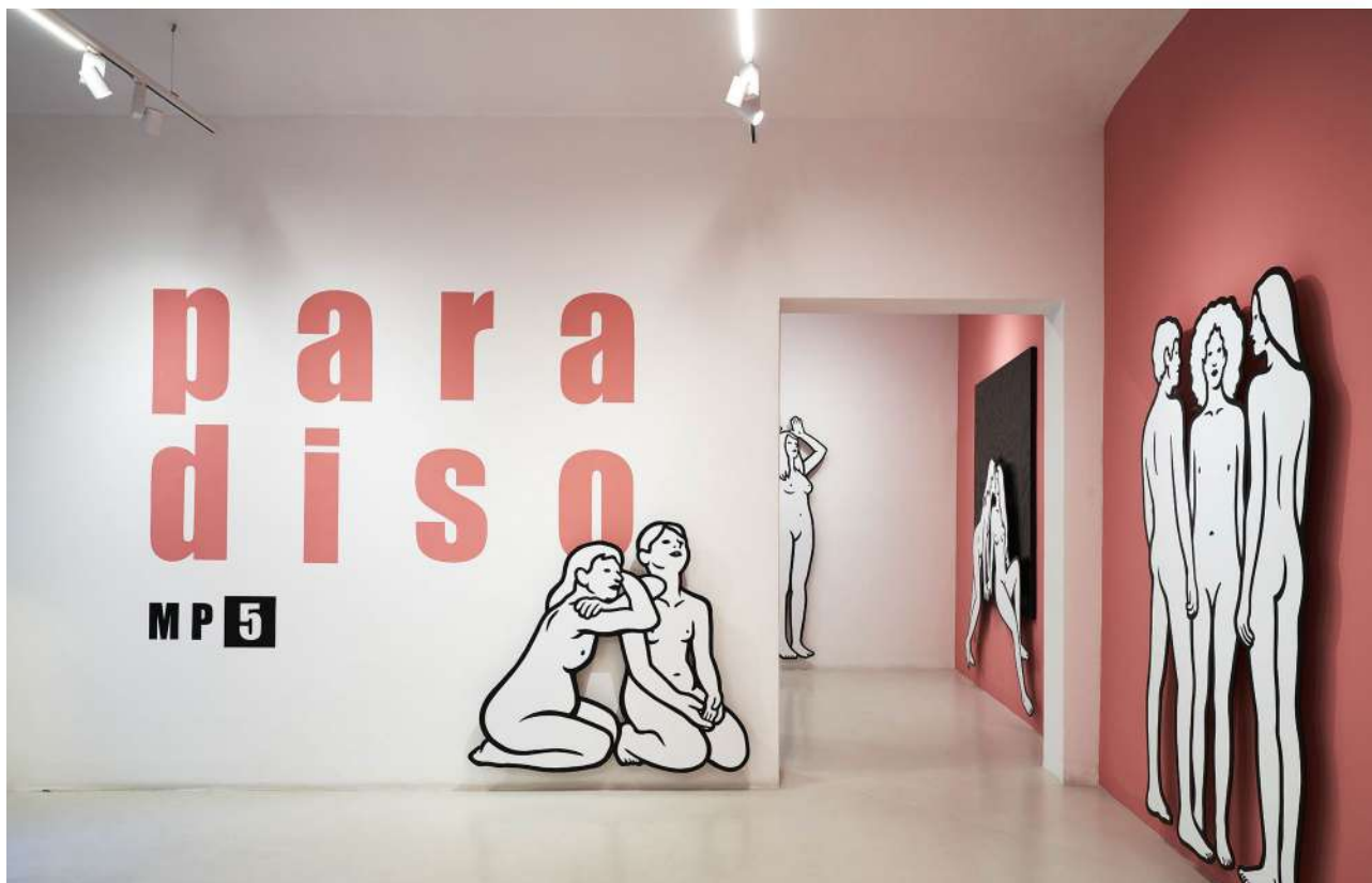
MP5 - “paradiso”, allestimento, SPAZIOC21.

In questa dimensione laica , rivelata dal rigoglioso fogliame di un giardino pensile disegnato per la parete centrale del cortile della galleria, le connotazioni binarie si dissolvono a favore di uno spazio intersoggettivo dove ognuno può ritrovare se stesso... Un habitat vivente in cui l'identità coincide con l'agire collettivo, dove siamo chiamati a riflettere proprio su quelle condizioni che permettono alle comunità di plasmare e coltivare un senso di spazio e di appartenenza”.