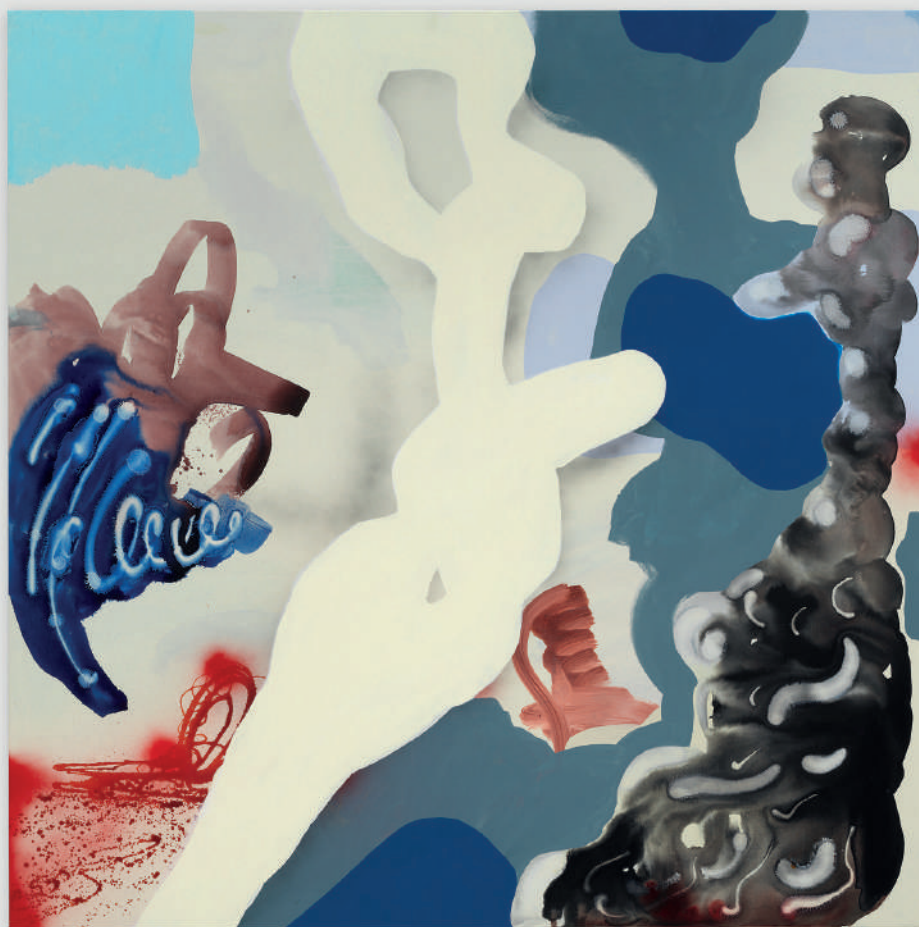
SPAZIOC21, EGS, Light Chiseled in Marble, 2025

La mostra è accompagnata da un libro fotografico in tiratura limitata di 100 copie, che documenta il processo creativo dell'artista attraverso tre sguardi d'eccezione: Paolo Pellegrin , fotografo di Magnum e premio World Press Photo, che ha seguito la produzione muranese; Marko Rantanen , autore finlandese noto per la sua sensibilità paesaggistica, che ha ritratto il lavoro a Lasismi; Valerio Polici , artista e fotografo romano, che ha raccontato la dimensione più intima e pittorica della residenza italiana.