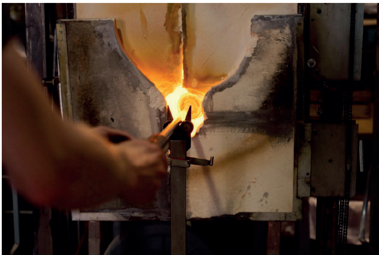
SPAZIOC21, EGS

SpazioC21 porta a Reggio Emilia EGS, artista finlandese che ha fatto dell'identità la materia della sua ricerca: in mostra anche una serie di opere realizzate a seguito di una collaborazione con uno storico laboratorio del vetro di Murano