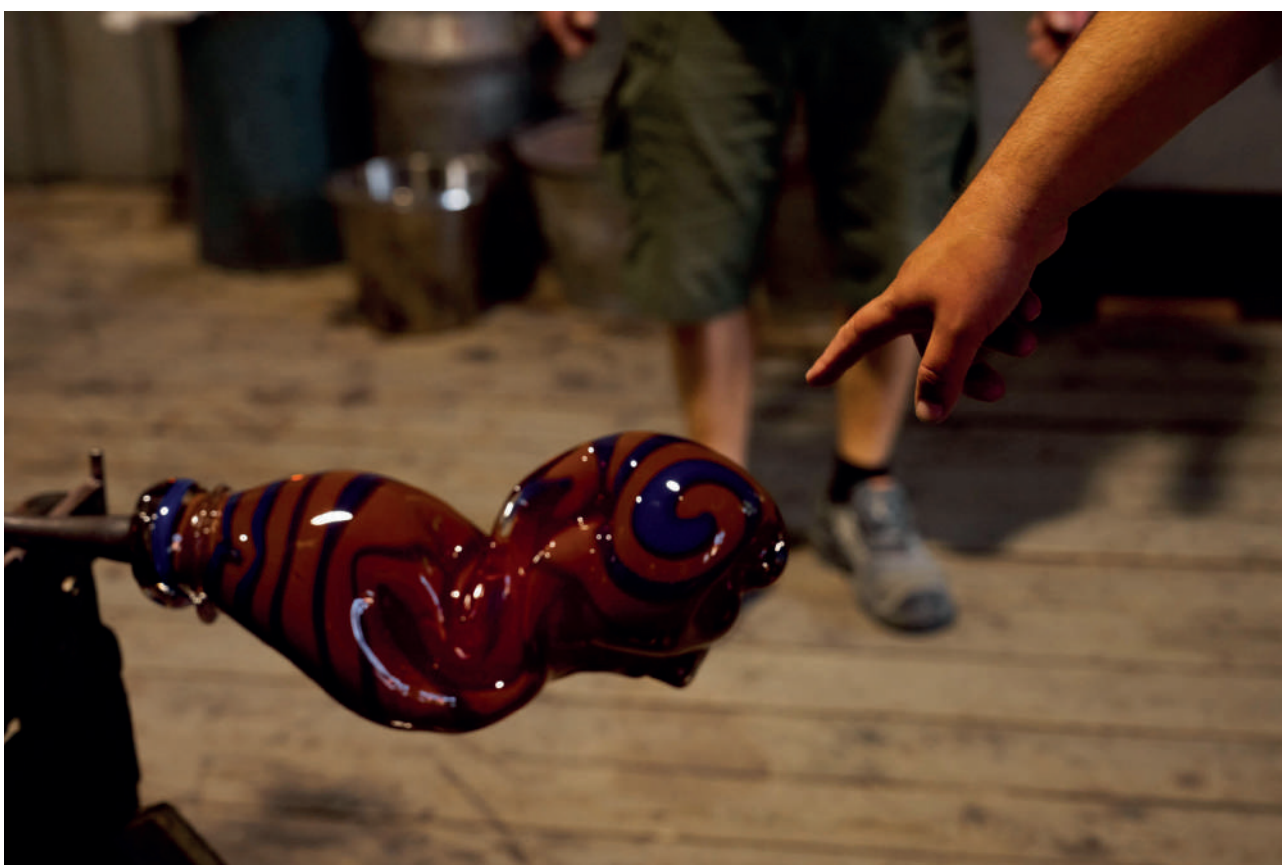
SPAZIOC21, EGS, Light Chiseled in Marble, 2025

Proseguendo questo rapporto, Invisible Identity è il risultato di un progetto di residenza avviato nel 2024 con SpazioC21, che ha portato l'artista a confrontarsi con due delle vetrerie più significative d'Europa: Lasismi , laboratorio finlandese che ha rilanciato la tradizione del vetro di Riihimäki, e la storica Seguso Vetri d'Arte di Murano, attiva dal 1397. Da questo doppio laboratorio nascono due capsule di sculture in vetro soffiato – circa 30 opere – esposte nella cornice di Villa Levi Terrachini.