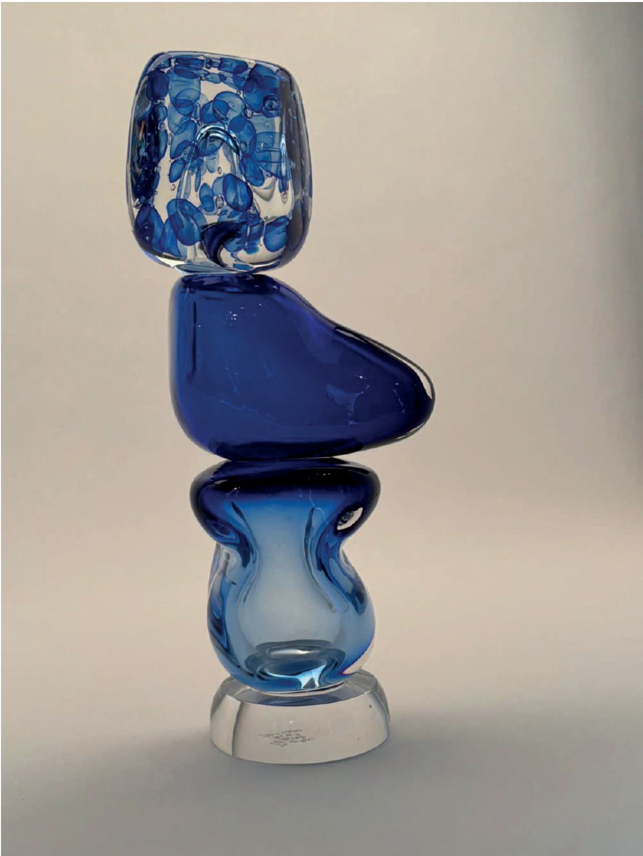
SPAZIOC21, EGS, LETTERS FROM THE SEA