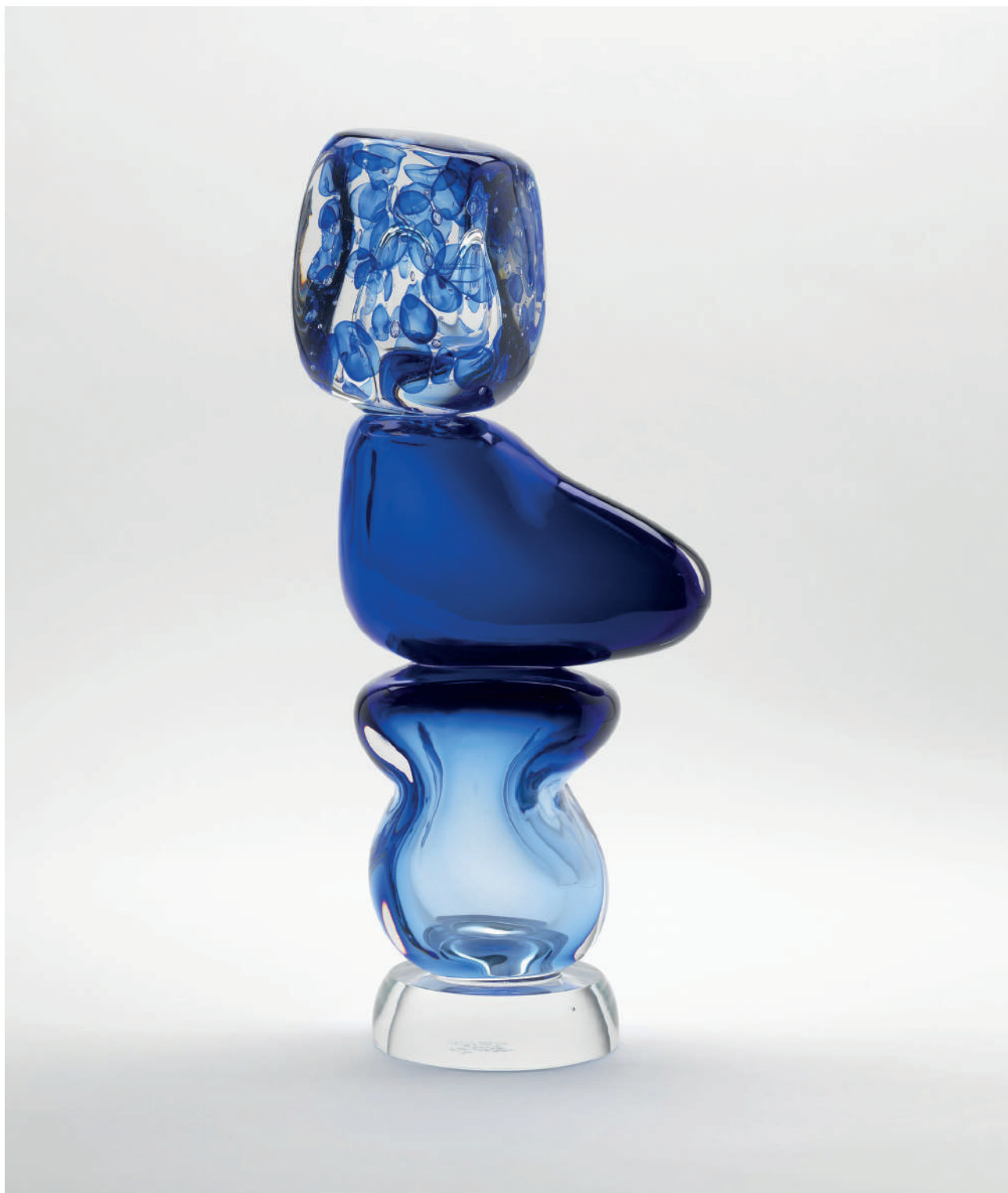
SPAZIOC21_EGS_LETTERS FROM THE SEA_47x20x14 cm

Che si tratti di disegni a inchiostro, sculture in vetro o graffiti sui muri del mondo, queste tre lettere formano un linguaggio visivo, un alfabeto personale che racconta storie e che integra nella pratica artistica riferimenti culturali, storici e popolari – specialmente temi quali l'identità, il luogo e il movimento – con forme astratte.