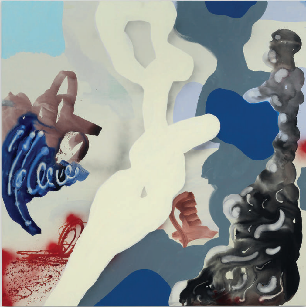
SPAZIOC21_EGS_Light Chiseled in Marble _2025_150x150 cm