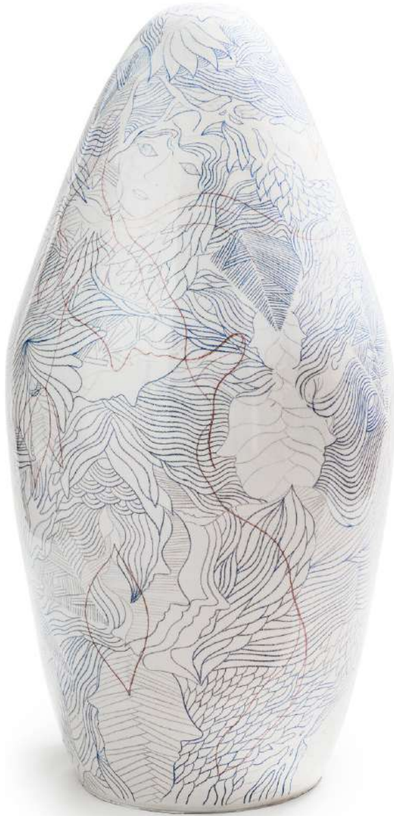
ARIS, SPAZIO21, photo Alessandro Bonori