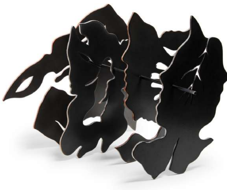
ARIS, SPAZIOC21

Più che un'evoluzione, Floating Shapes sembra una dichiarazione di posizione. Nella mostra inaugurata da SPAZIOC21 a Reggio Emilia, e aperta al pubblico fino al 18 aprile 2026, ARIS porta a compimento un passaggio che era nell'aria da tempo: il segno da superficie urbana diventa struttura spaziale.