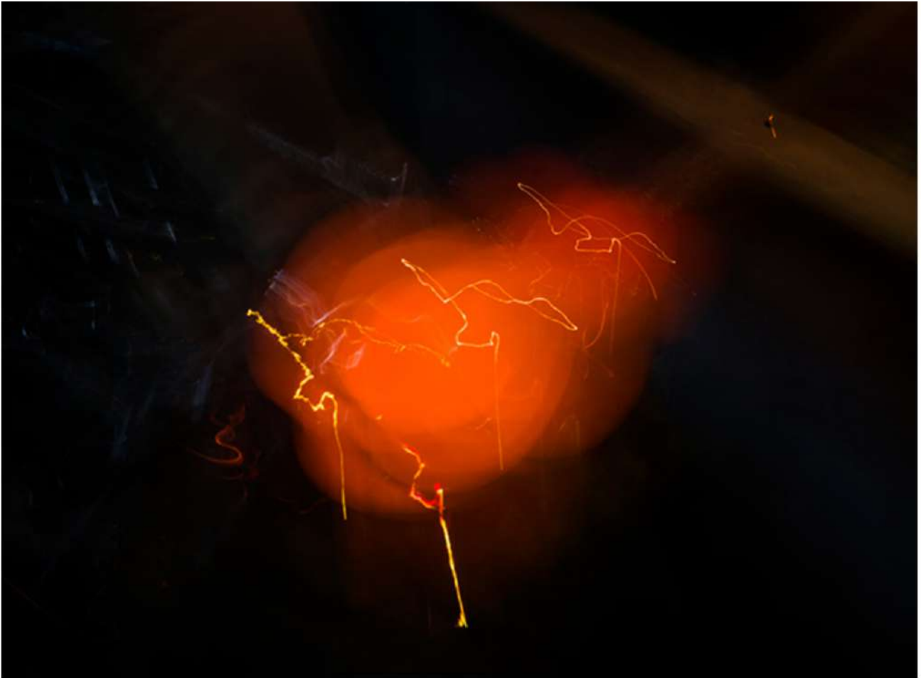
SPAZIOC21 – PAOLO PELLEGRIN, Untitled, 2025, 74,5 x 100 cm.

La composizione attenta e geometrica dello scatto guida l'occhio dello spettatore verso il soggetto principale – un attrezzo, una scheggia di vetro o una palla di fuoco – mantenendo un forte equilibrio visivo, un contrasto acuto tra luce e ombra, che crea un realismo drammatico e dei chiaroscuri teatrali che accentuano l'identità dei soggetti ritratti.