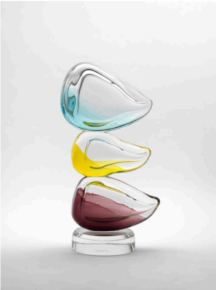
SPAZIOC21, EGS, Hourglass That Dreamed of Time, 2025

Il progetto presentato al Padiglione 26 di Arte Fiera si inserisce coerentemente nella ricerca di SpazioC21, galleria fondata a Reggio Emilia nel 2016 da due collezionisti attivi da decenni nello studio delle sottoculture urbane, dell'arte underground e delle pratiche di attivismo. Come in tutte le iniziative di do ut do, anche questa mostra unisce dimensione culturale e responsabilità sociale: una quota del ricavato delle vendite sarà devoluta alla Fondazione Hospice MT Chiantore Seragnoli di Bologna. Un gesto che rafforza l'idea di "dare per dare" alla base del progetto, in cui l'arte non è solo oggetto di mercato o di contemplazione ma occasione di cura.