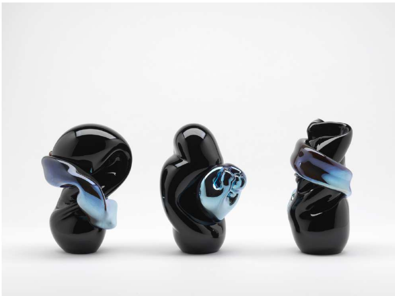
SPAZIOC21, EGS, Blurred Coordinates, 2025

Le sculture di EGS, esposte accanto alle fotografie, ampliano questo discorso sul piano tridimensionale. Vetri soffiati realizzati a Murano dialogano con esemplari unici prodotti in Finlandia, dando vita a un insieme di forme plastiche, curvilinee e sensuali, attraversate dalla luce. Per l'artista finlandese, nato a Helsinki nel 1974, l'identità è una cartografia emotiva, un sistema fluido plasmato dal viaggio, dalla memoria e dalle geografie attraversate. La trasparenza e la distorsione del vetro diventano strumenti per indagare ciò che è visibile e ciò che resta nascosto, tra presenza e scomparsa, fragilità e resistenza.