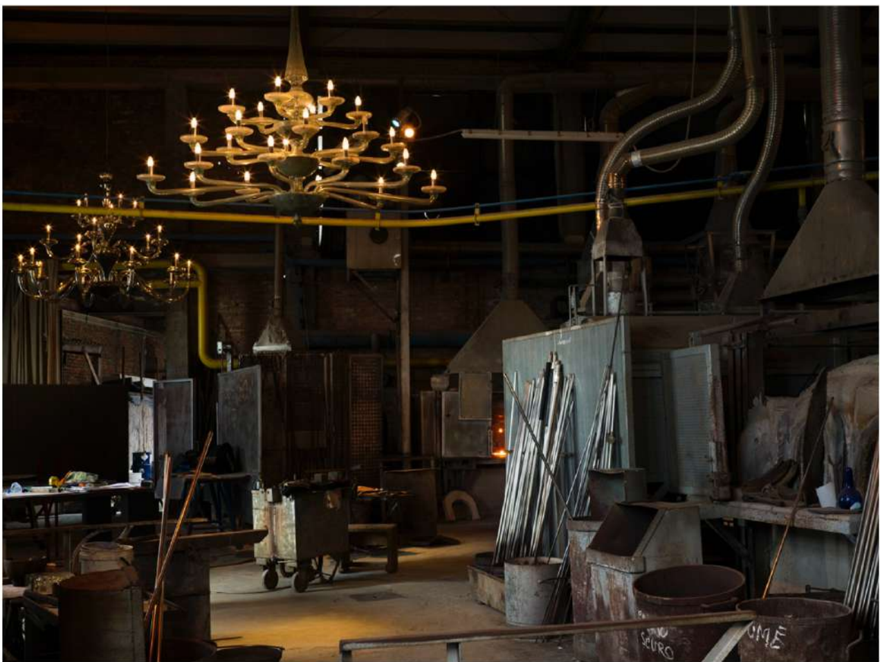
SPAZIOC21, PAOLO PELLEGRIN, Untitled, 2025

Il confronto tra i due artisti si iscrive nel tema dell' Identità , scelto da do ut do come filo conduttore per il ciclo 2026. SpazioC21 costruisce questo dialogo partendo da una relazione concreta di lavoro: le grandi fotografie a colori di Pellegrin, realizzate nell'estate del 2025 all'interno della storica vetreria Seguso Vetri d'Arte a Murano, documentano e reinterpretano il backstage della produzione delle sculture in vetro soffiato di EGS. Si tratta di una sospensione del tempo: immagini dense, quasi metafisiche, in cui lo spazio della fornace, i suoi strumenti e i suoi frammenti diventano soggetti autonomi, carichi di tensione visiva.